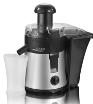
Juice Extractor AD 4106