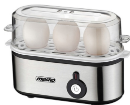
Egg Boiler MS 4486