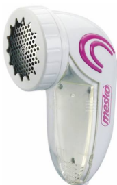
lint remover MS 9607