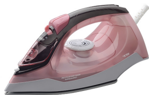
Steam Iron MS 5028