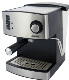
Espresso Machine MS 4403