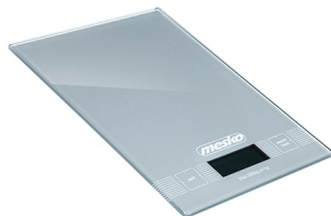
kitchen electronic scale MS 3145