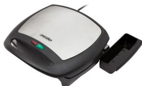
Diet electric grill MS 3035